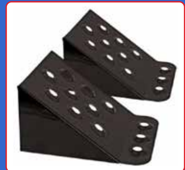
Steel wheel chocks

Additionally, the positioning of wheel chocks during parking is also crucial for safety to prevent accidents or injuries. It is important to ensure that the wheel chocks are installed in a flat area, stable, and provide adequate space for the vehicle to stay stationary. Pay close attention to the installation process to prevent tipping, ensuring the optimal functionality of the wheel chocks.