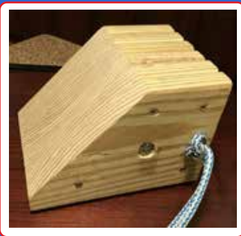
Ganjalan roda terbuat dari kayu