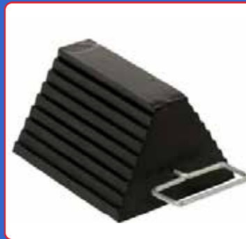
Ganjalan roda terbuat dari karet