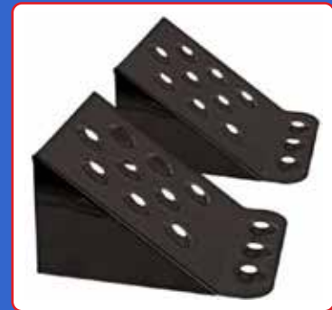
Ganjalan roda terbuat dari besi

Selain itu, penempatan ganjalan roda saat parkir juga penting untuk keselamatan guna mencegah terjadinya kecelakaan atau cedera. Perlu dipastikan pemasangan ganjalan roda ini berada di tempat yang datar, stabil, dan menyediakan ruang yang cukup agar kendaraan tetap diam. Perhatikan juga cara pemasangannya agar tidak terbalik dan fungsi ganjalan roda tetap optimal.